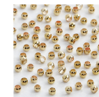
Lukitushelmi, halk. 2 mm, kullanvärinen, 100kpl 60106