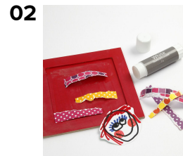
Revi Colorbar-papereista paloja ja kiinnitä ne aluseen liimalla tai kaksipuolisella teipillä. Voit lisätä mukaan piirroksen tai valokuvan.