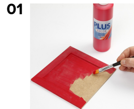
Maalaa pannunalunen Plus Colorilla.

Nämä ihastuttavat kollaasit on tehty revityistä ja leikatuista Colorbar-papereista jotka on liimattu pannunaluseen. Kehys ja pohja on ensin maalattu Plus Color-väreillä. Piirustukset on piirretty ennen paperin liimaamista.