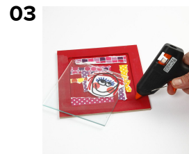
Kiinnitä alusen lasilevy paikoilleen liimapistoolilla tai kirkaaksi kuivuvalla liimalla. Jos haluat laittaa teoksen seinälle, kiinnitä sen taustapuolelle ripustustarra.