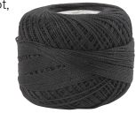
Puuvillalanka, musta, 20g 42127