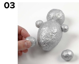
Pyöritä palloja ja kiinnitä jaloiksi.