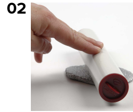
Kauli helmimassapallo ohueksi ja anna kuivua.