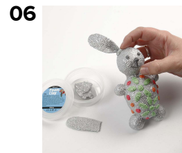
Kiinnitä korvat helmimassalla.