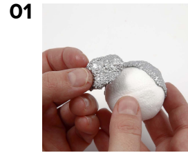
Päällystä styroxpallo helmimassalla.

Veikeät pääsiäiseläimet tehtiin styroxpaloista ja -munista, jotka päällystettiin metallic-helmimassalla. Korvat, siivet ym. tehtiin helmimassasta, joka kaulittiin litteäksi, annettiin kuivua, leikattiin muotoon ja "liimattiin" eläimeen helmimassalla.