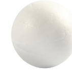
Pallot, halk. 4 cm, valkoinen, styrox, 10kpl 543021