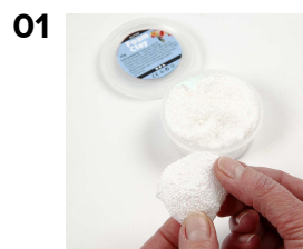
Litistä möykky helmimassaa.

Styroxmunat on päällystetty kimalle helmimassalla. Ripustuslenkiksi on kiinnitetty organzanauha.