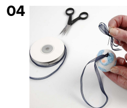
Kun kaikki on kuivunut tee pieni rusetti organzanauhasta ja kiinnitä se ripustuslenkin kanssa munaan nuppineulalla.