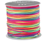
Makrameenyöri, paksuus 1 mm, neon multi, 28m 41723