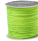
Makrameenyöri, paksuus 1 mm, neonvihreä, 28m 41722