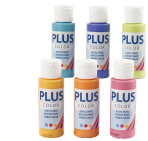
Plus Color-askartelumaali värikäs, 6x60ml 39695