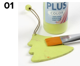
01 Maalaa koristeet ja anna kuivua.

Jokainen koriste maalattiin eri värisellä Plus Color-askartelumaalilla. Värikkäät puuhelmet pujotettiin metalliseen kukkalankaan ja kiedottiin koristeiden ympärille.