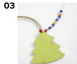
03 Pujota puuhelmiä kukkalankaan.