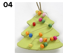
04 Kiedo kukkalanka muutaman kerran koristeen ympäri ja lukitse kiertämällä lankaa itsensä ympäri.