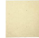
Käsintehty luonnonpaperi, arkki 20x20 cm, 70 g, off-white, 10ark 220350