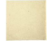
Käsintehty luonnonpaperi, arkki 20x20 cm, 70 g, off-white, 50ark 22035