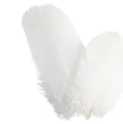
Höyhenet, n. 8 cm, valkoinen, 3g 51816