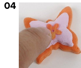
Paina paljetti silkkimassaan.