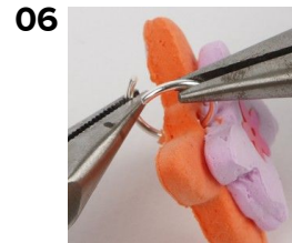
Kiinnitä välirengas reikään.