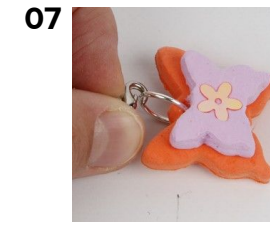
Kiinnitä kännykkänauha välirenkaaseen.