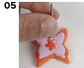
Tee neulalla ripustusreikä.