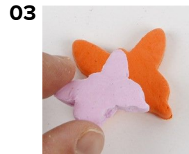
Yhdistä nämä kaksi hahmoa.