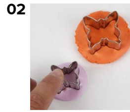
Leikkaa muotilla silkkimassasta kaksi erikokoista hahmoa.