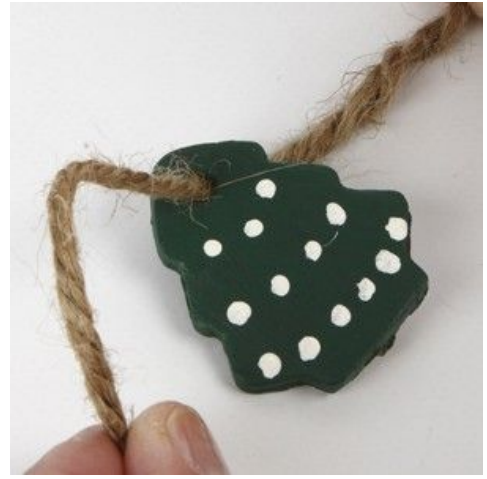
4 Attach a piece of string for hanging.