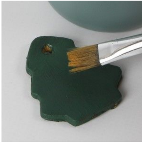
3 Paint and decorate.