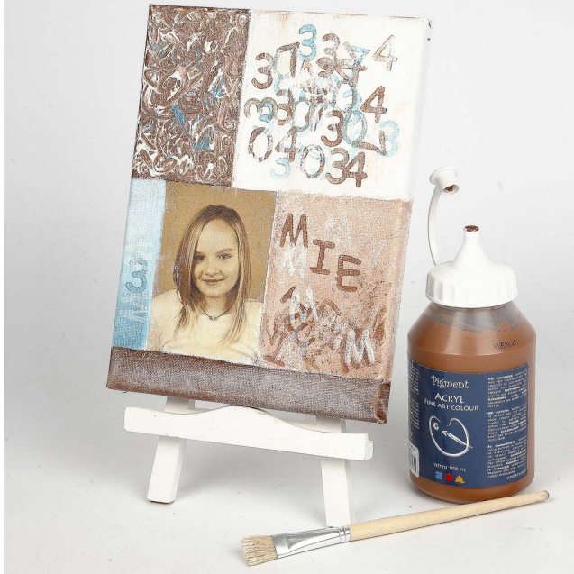
Foto överförd till målarduk